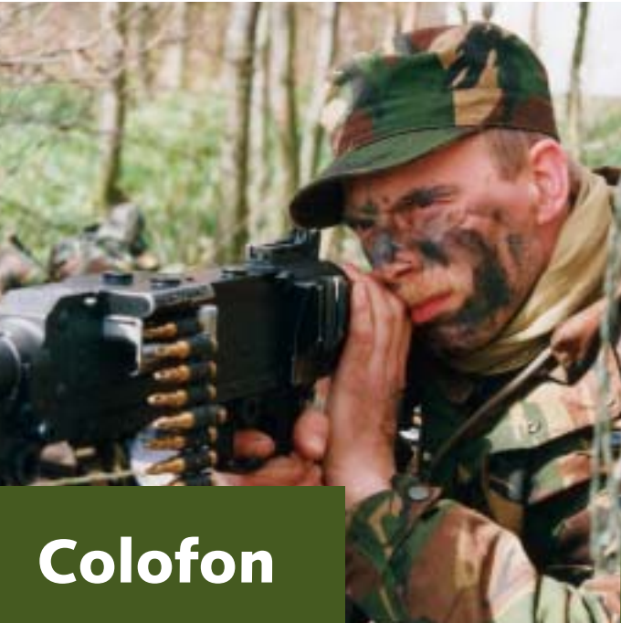
Een Natresmilitair tijdens een bewakingsopdracht op een mobilisatiecomplex.